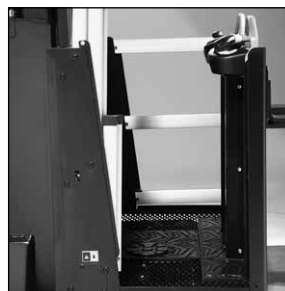
Puertas ligeras y suaves