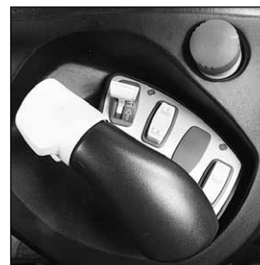
Mando joystick de uso sencillo