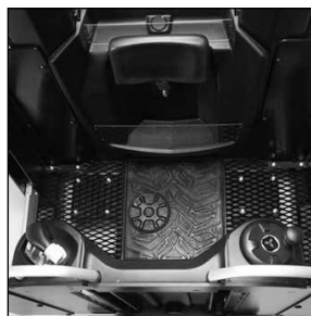
Diseño de cabina sencillo