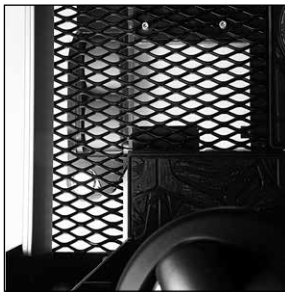
Suelo a través del que se puede ver