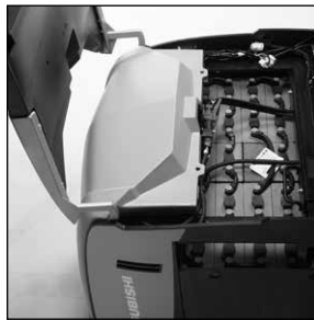
Tapa de batería ligera